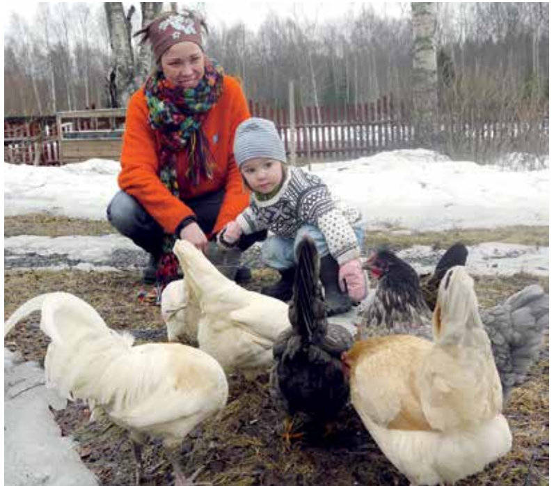
Att dottern Joy hjälper till när hönsen ska matas är självklart.

– Visst tar det längre tid och kan bli lite kladd-