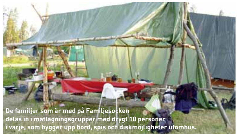
De familjer som är med på Familjesocken delas in i matlagningsgrupper med drygt 10 personer i varje, som bygger upp bord, spis och diskmöjligheter utomhus.