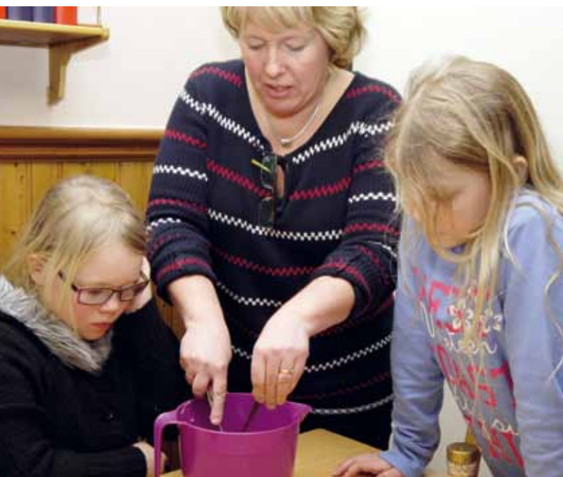
Den kvällen Nära hälsade på hos Salt-gruppen var det bakning av bl a annat snickerskakor, dumlekakor och meltaways, något som kräver stor noggrannhet och koncentration.