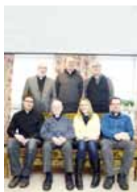
Omslagsbild: Sju av de nio präster som bor i Bureå församling.