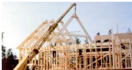
Under sommaren 1976 sattes takstolarna på plats.

Sedan dess har det bedrivits en omfattande verksamhet i de trevliga och ändamålsenliga lokalerna. Förutom gudstjänster har EFS-föreningen inbjudit till trivselkvällar, tematräffar, missionsaftnar, sångkvällar och scouting.