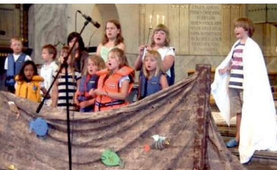
Sommarskoj 2009 avslutades med att barnen medverkade på gudstjänsten i kyrkan.

Även i sommar blir det samma koncept för kyrkans Sommarskoj, för barn i klass 1-5, som det var sommaren 2009. Det innebär att vi håller på endast en vecka, från måndag 28 juni till söndag 4 juli.