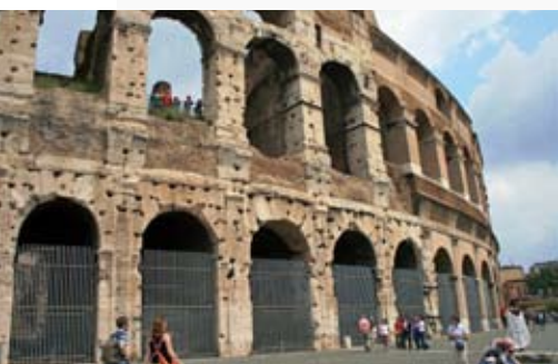
Colloseum var en av de historiska platser som besöktes under vistelsen i Rom.

– För mig var nog det bästa att jag blev tillfrågad om att följa med. Det betydde jättemycket för mig! Allting var trevligt! Det var så mycket som vi fick se och uppleva tillsammans. Även om vi gjorde olika saker på dagen så avslutade vi med en gemensam middag. För dig som inte fick följa med finns det ett unikt tillfälle att "nästan" göra samma resa! Fredag 17 oktober, kl 19 är du välkommen till församlingsgården. Då ska personalen berätta om sin resa till Rom. Och det blir inte bara med ord. Du kommer att få se bilder och film, och kanske får du till och med möjlighet att äta pizza!